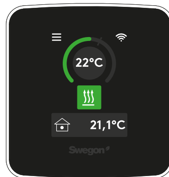
Swegon CASA Genius-kontrollpanel