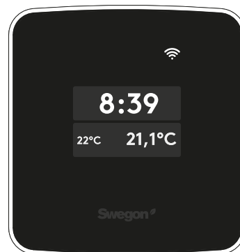
Swegon CASA App