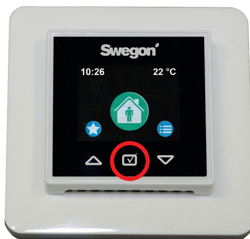
Menu de base

Augmente automatiquement la ventilation pour éliminer l'excès d'humidité dans l'habitation. Lorsque le système augmente automatiquement la ventilation, le symbole correspondant au boost lié à l'humidité s'affiche à l'écran.