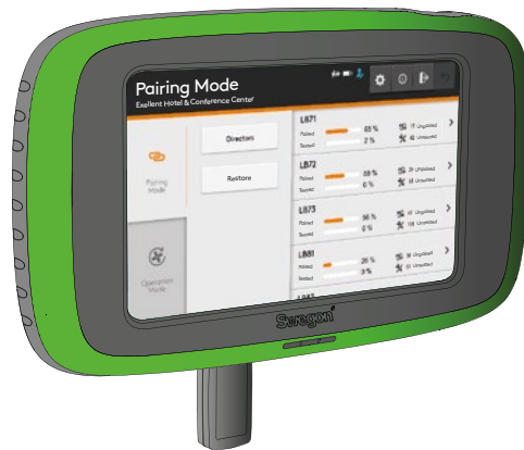
Figur 1. Handterminal TuneWISE med monterad Connect WISE-USB.