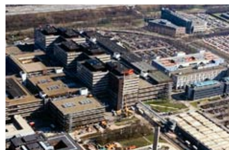
AMC Hospital, Nederländerna Hospital Solution

Läs mer om Swegon Solutions på www.swegon.com