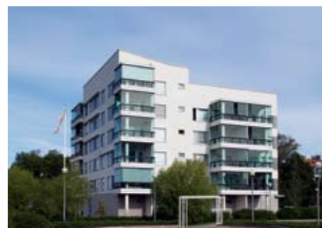
Kerrostalo, Finland Home Solution