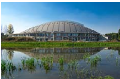
Pruszków Welodrom, Polen Arena Solution