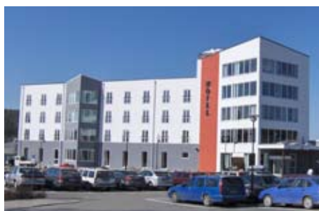
Hotel Årjäng, Sverige Hotel Solution