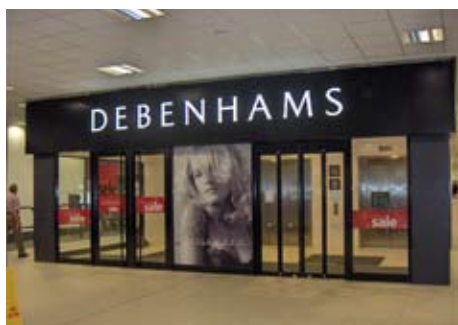
Debenhams, Storbritannien Retail Solution