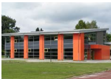
Skola Sögel, Tyskland School Solution